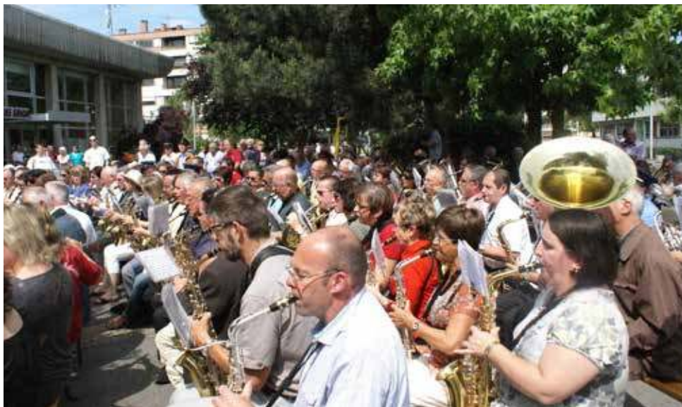
  Vieilles Casquettes

La ville de Gaillard et son orchestre accueilleront la traditionnelle f te des Vieilles Casquettes, un  v nement festif rendant hommage aux musiciens chevronn s du Faucigny.