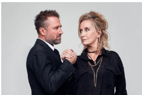
SAISON CULTURELLE : un festival d'émotions.