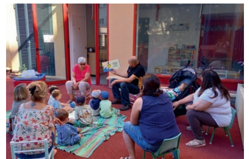
SENIORS : des actions renforcées.