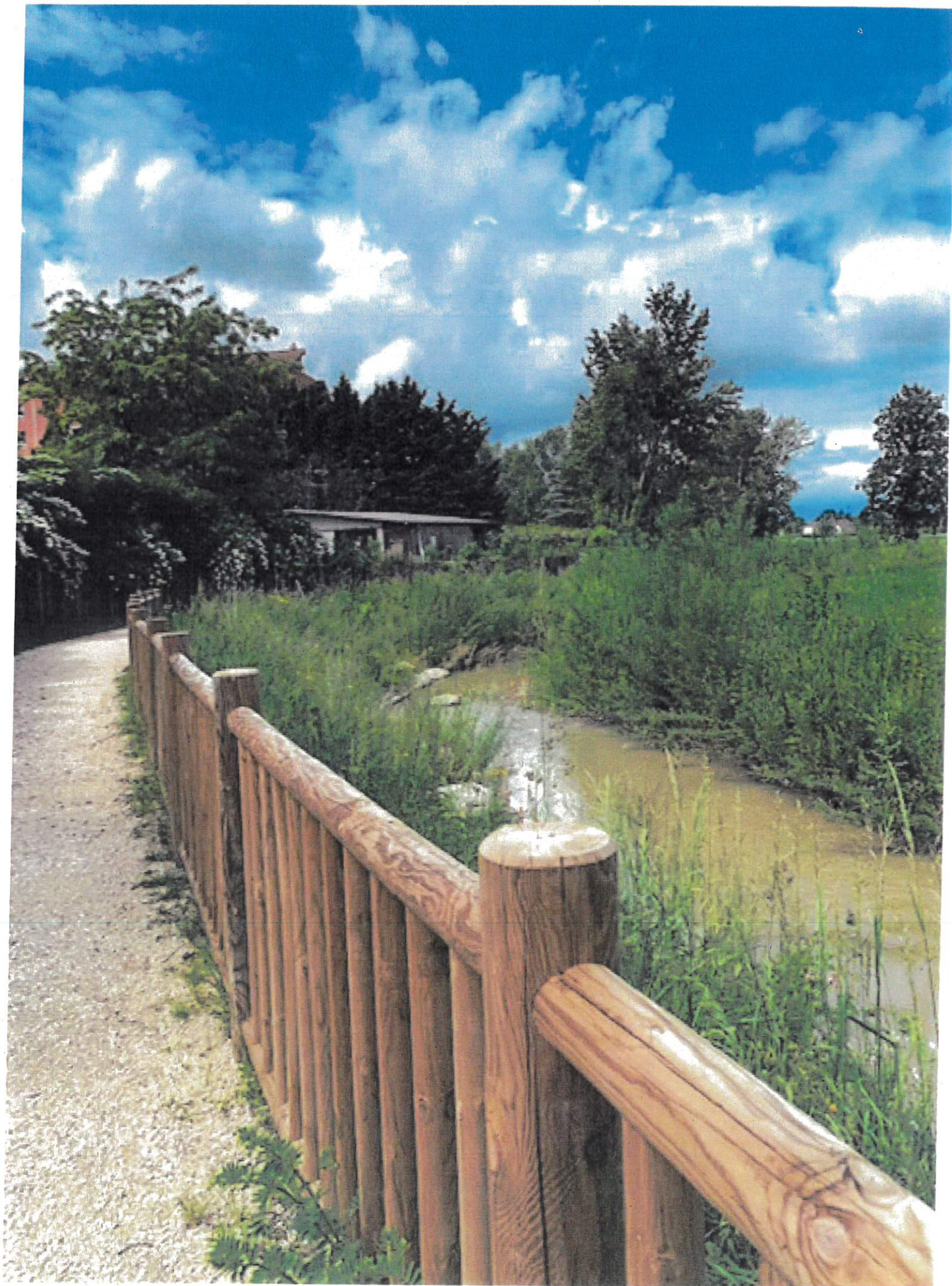
Déviatiou cit du Foron Rue du Foron Vill-la-guand