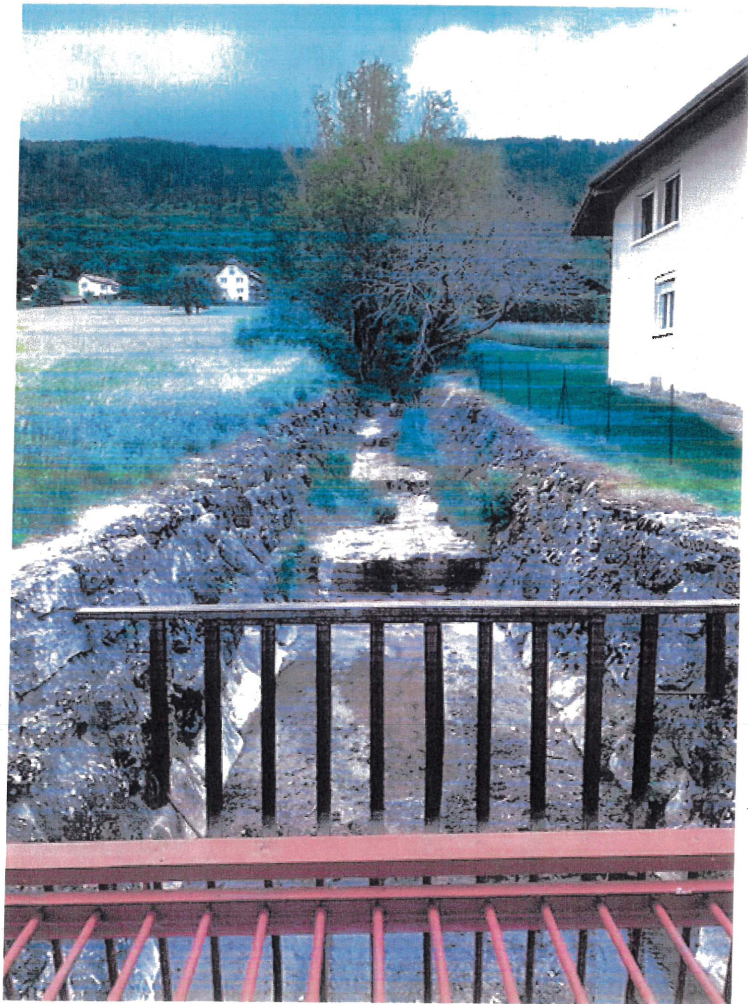
Affluent Foron canalik. St Cergues -