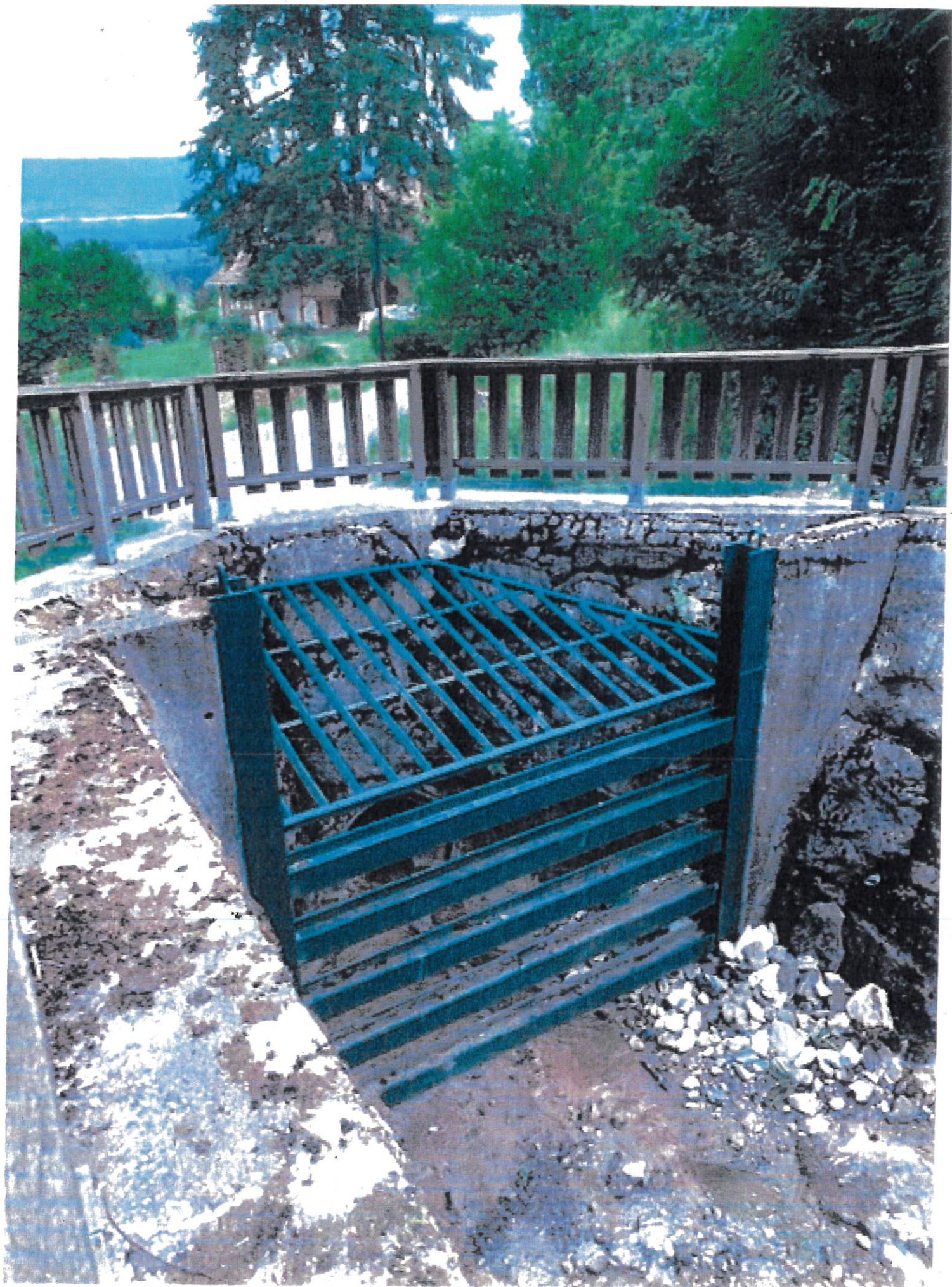
BOSE affluent FORON. → école St Cergues.