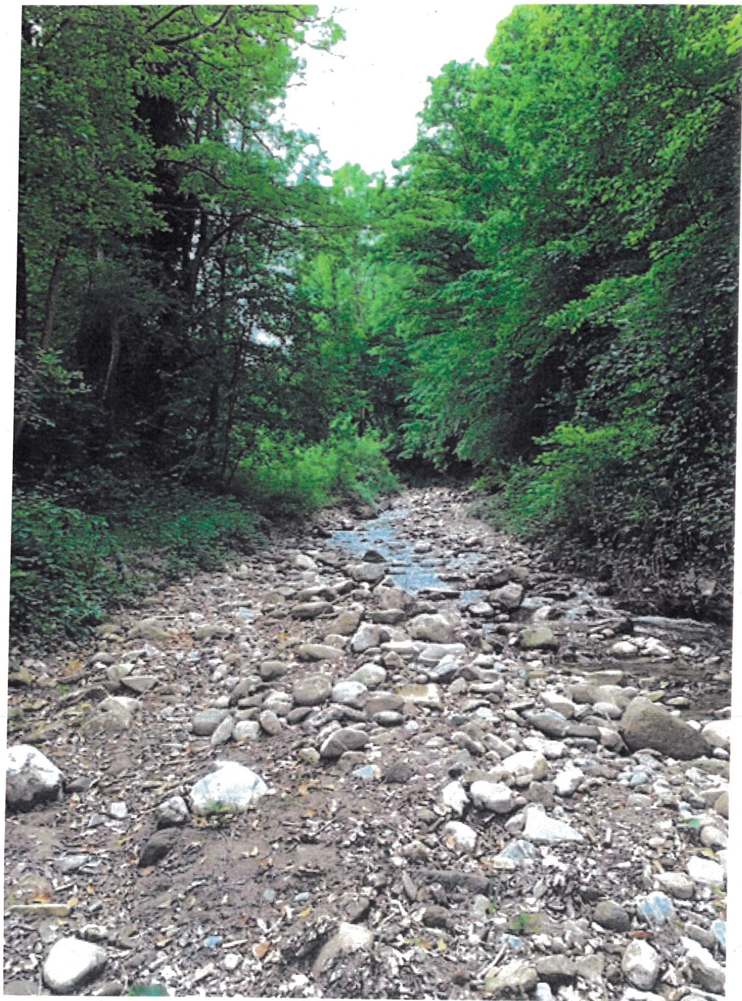
Bassin de sédimentation sur la chaudière