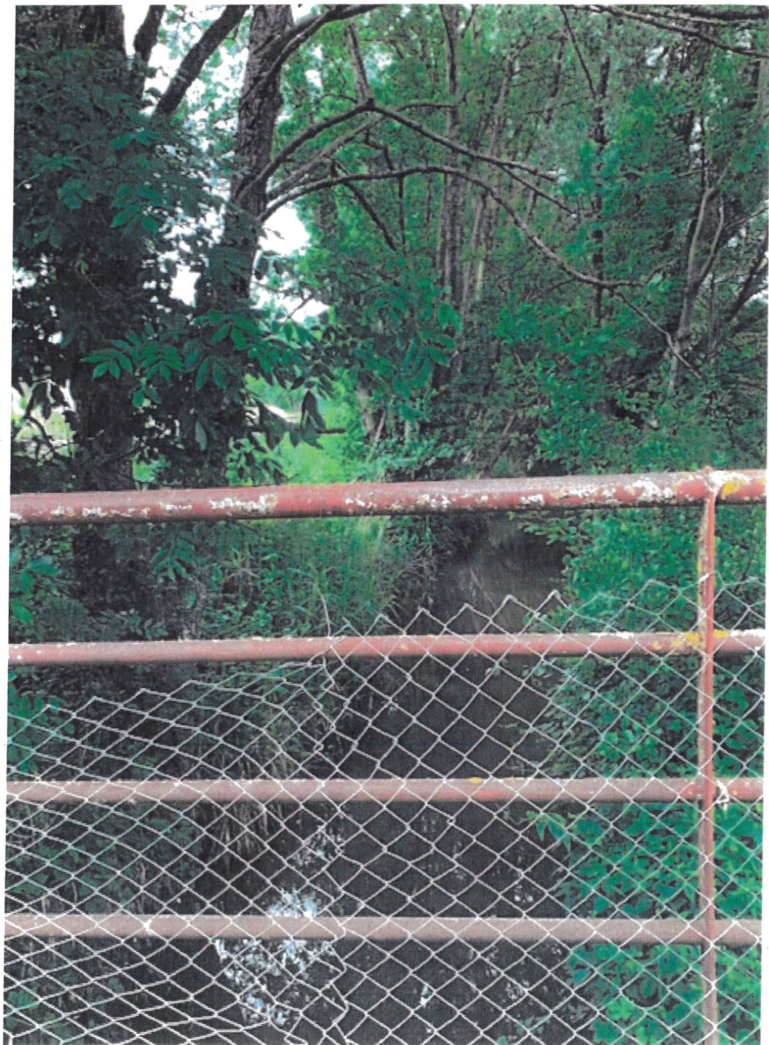
FORON - JUVIGNY