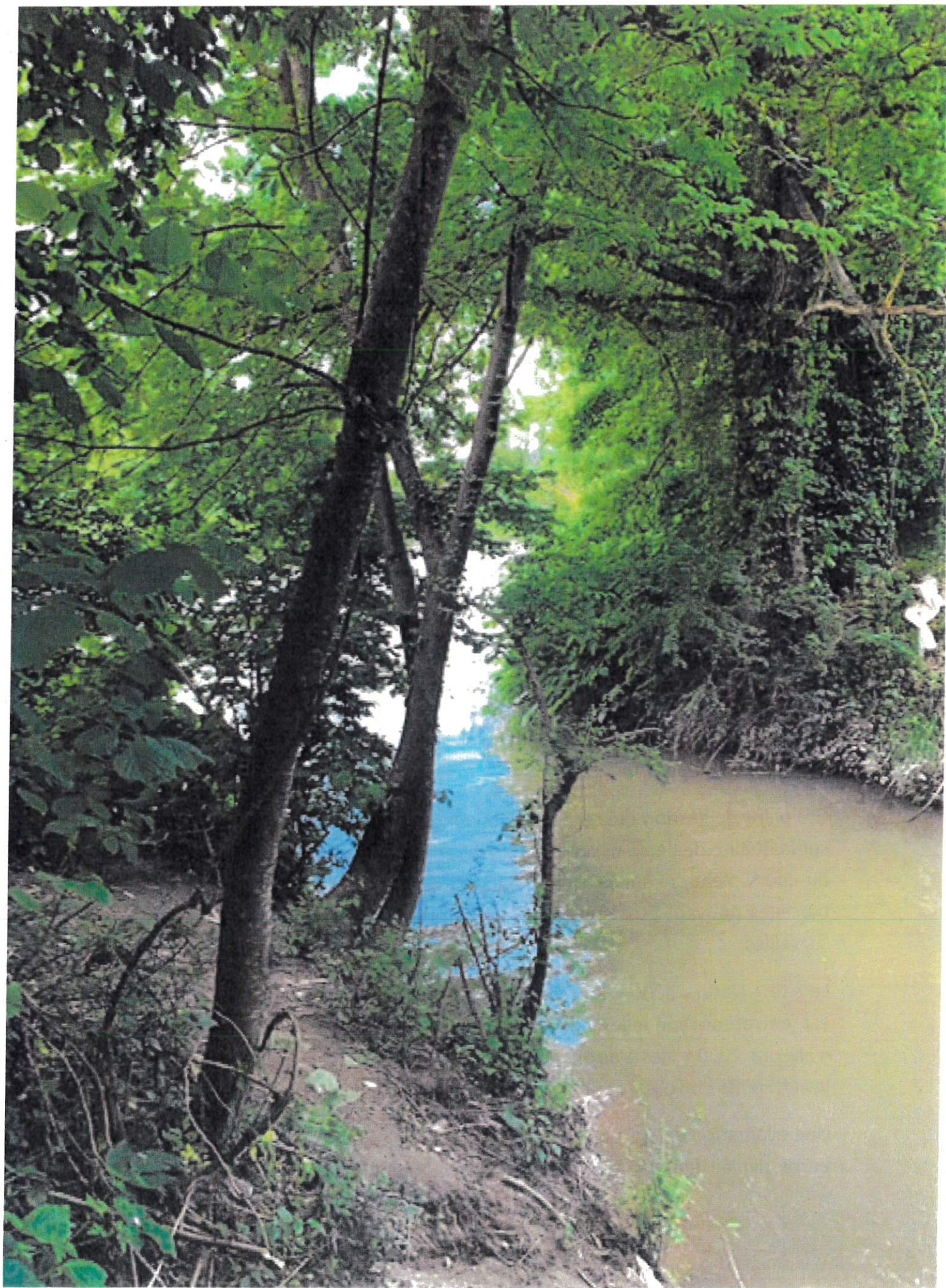
Confluent Foron - Arve Gailhard.