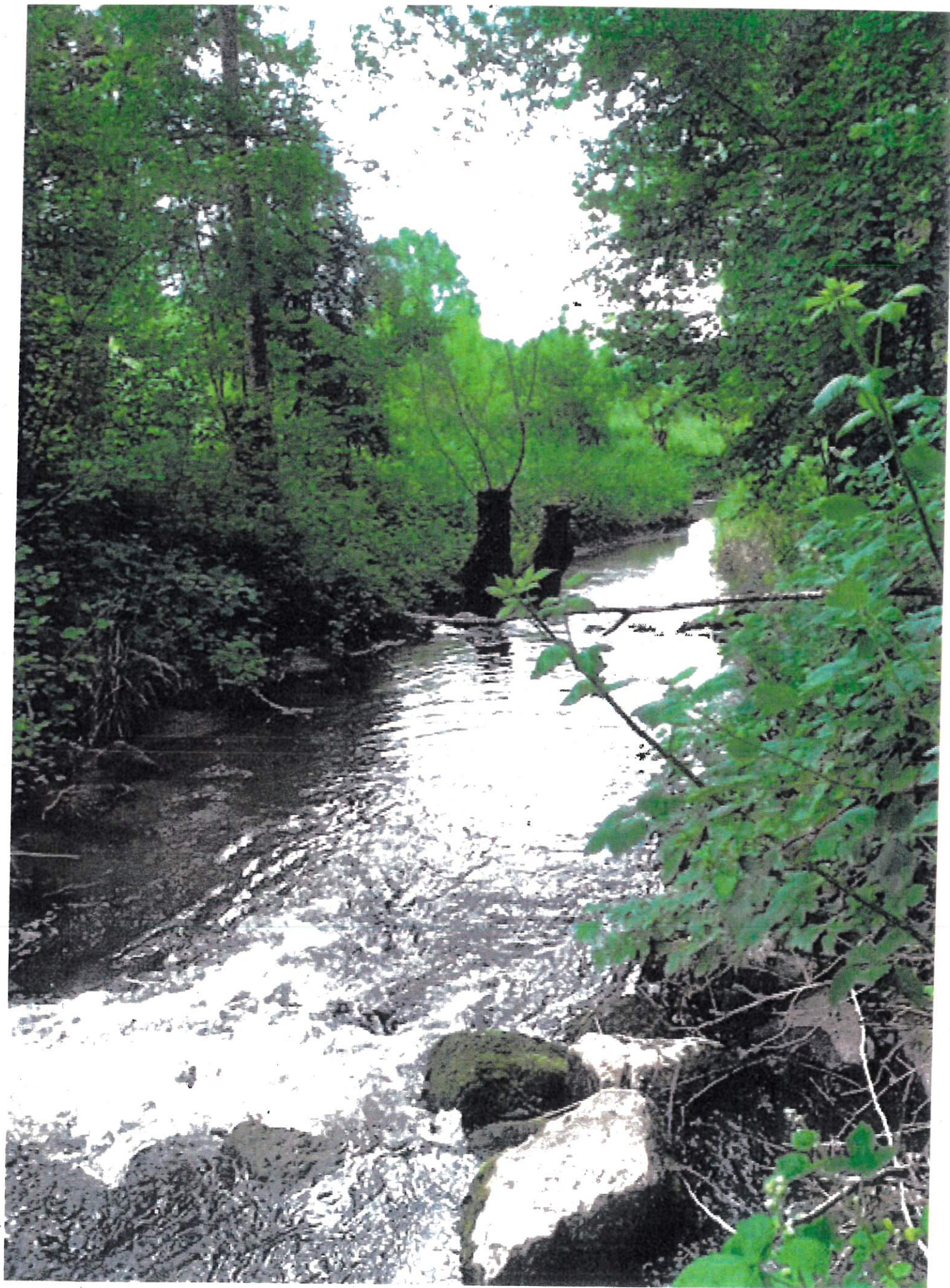
Lit du FORON JOUVÉNY