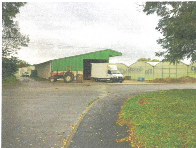
Bâtiments construits sur la canalisation (photo JP Lafond - 5/10/2012)

L'établissement de la servitude sur cette canalisation n'est donc pas possible. La proposition de déplacer la canalisation pour contourner les bâtiments n'est pas recevable puisque non prévue dans le dossier soumis à enquête publique.