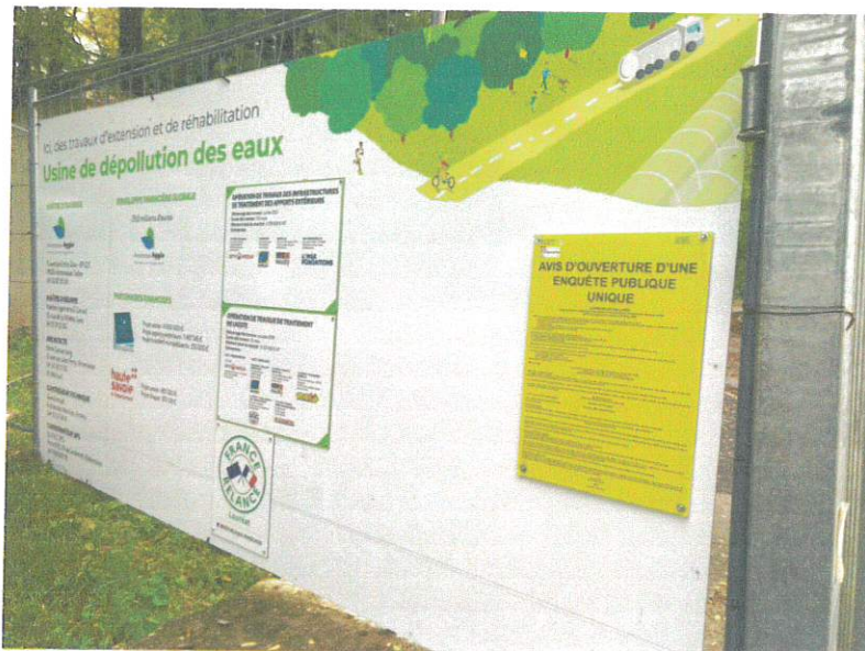
Affichage sur le site (Photo JP Lafond 05/10/202)

J'ai personnellement pu constater la publication initiale de l'avis d'enquête sur les sites internet et sur place l'affichage de cet avis.